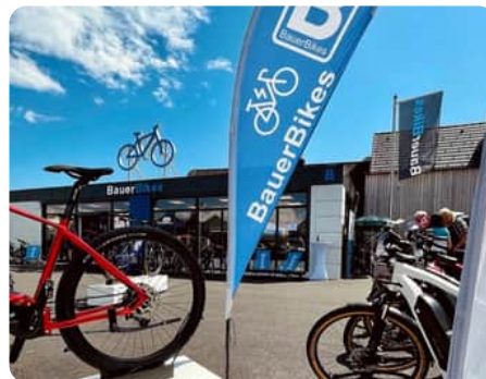
E-Bike Store St. Margarethen

Puntigamer Straße 124, 8055 Graz +43 316 292 671 info.graz@bauerbikes.com