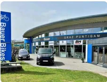
E-Bike Store Graz Puntigam

Puntigamer Straße 124, 8055 Graz +43 316 292 671 info.graz@bauerbikes.com